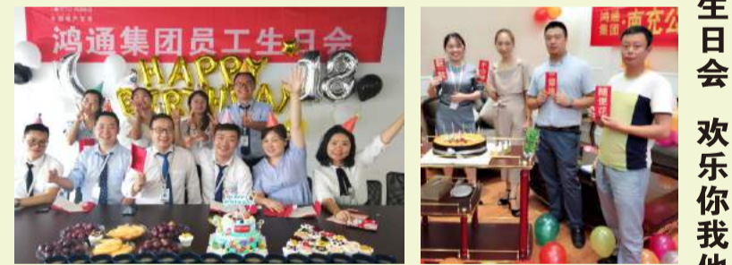
▲集团总部第一次员工生日会 ▲南充分公司第一次员工生日会

为践行“以爱建家 乐享生活”的文化理念，营造鸿通大家庭的温暖氛围，鸿通集团举办员工生日会。