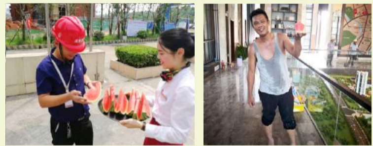
▲乐山分公司送清凉活动现场 ▲南充分公司送清凉活动现场

酷暑时节，鸿通集团总部及南充、乐山公司开展起“夏日送清凉”活动，以点滴关怀送一夏清凉。