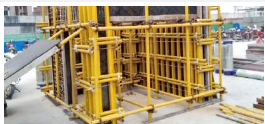
鸿通·凤凰国际： 工法样板展示区。