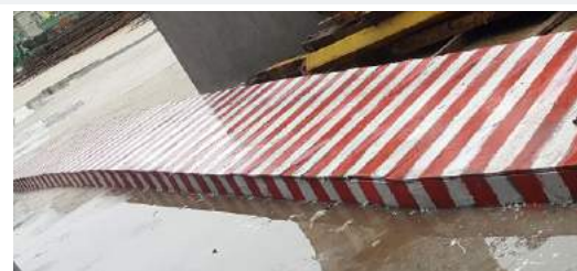
鸿通·凤凰国际： 后浇带按规范要求封闭，防止雨水进入地下室。