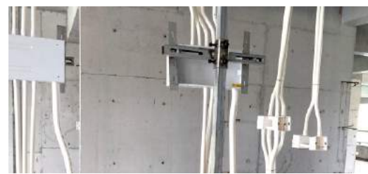
鸿通·南玺台： 强弱电配电箱及管道先预埋固定，砌体一次性施工到 位，避免二次开槽，防空鼓开裂措施到位。