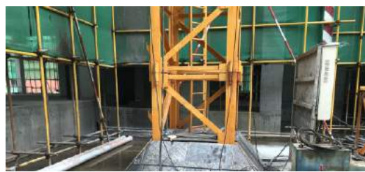
鸿通·凤凰国际： 塔吊口封闭完善，防护到位。