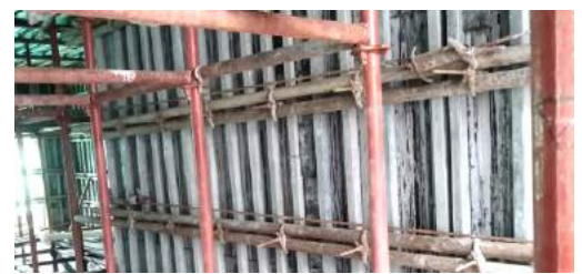
鸿通·南玺台： 剪力墙采用5道对拉螺杆加固，避免混凝土浇筑过程中 模板变形，支撑体系牢固确保工程成型指标合格。