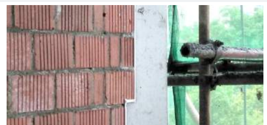
鸿通·翡翠华庭： 砌体施工马牙槎留置标准。